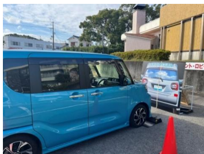
▲サポカー体験の様子