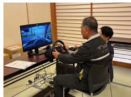
▲ドライビングシミュレータ体験の様子