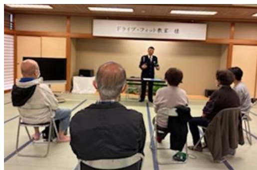
▲白浜警察による講義の様子

第1回目（11月20日）は7名の方が参加され、白浜警察による「高齢者交通事故の現状」についての講話、機器を使った反射神経・判断力・握力などの測定で自分の運転力をチェックしていただきました。