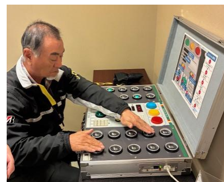
▲身体機能測定の様子