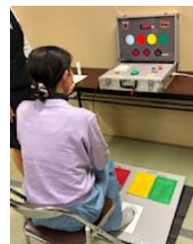
▲クイックステップの様子

今後もJ A・J A共済連と連携し、地域貢献活動を通じて地域との絆を強化し、地域の皆さまが健康で安心して暮らせる豊かな地域社会づくりに貢献していきます。 実施を希望される場合は、福祉協会までお問合せください。