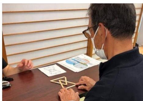
▲認知能力測定の様子